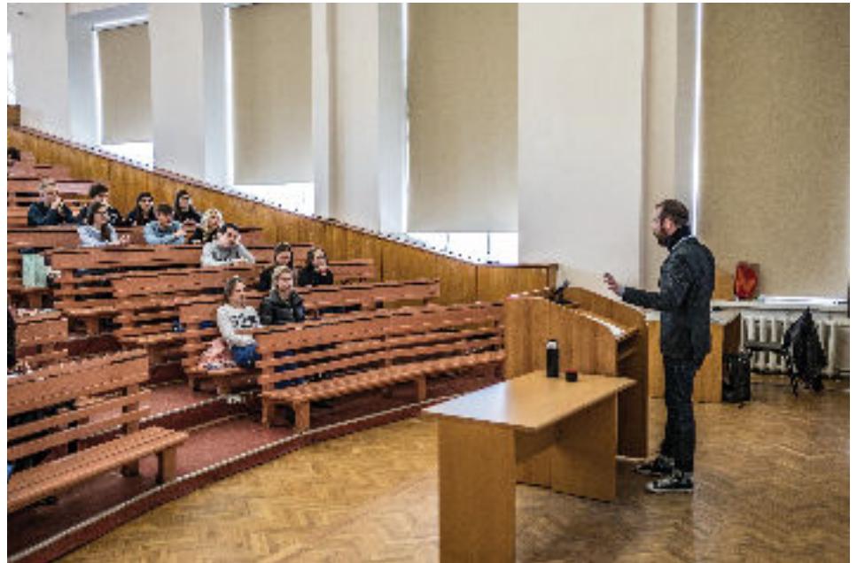
V úvode kurzu som študentom v prednáške predstavil tému môjho výskumu

Okrem spoznávania miestnej kultúry a objavovania nových zákutí mesta som sa v posledných týždňoch venoval aj pracovným povinnostiam. Popri archívnom výskume som začal vyučovať na mojej hosťovskej univerzite. Pre približne 70 študentov