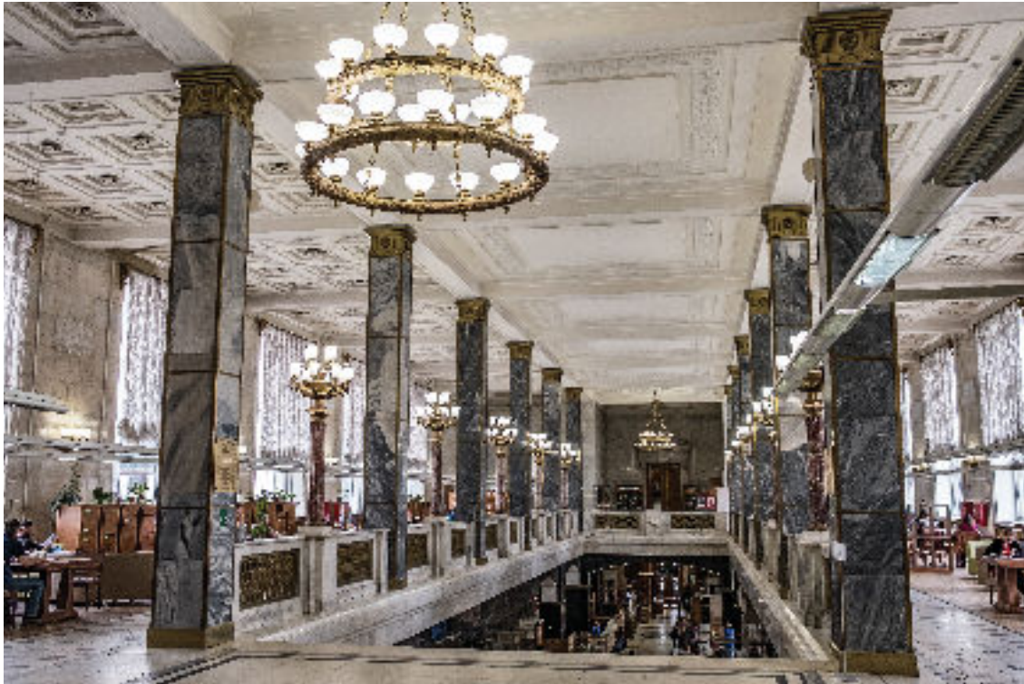
V Ruskej štátnej knižnici

Na vyučovanie som sa samozrejme musel tiež pripravovať a dodatočne ešte napísať dva príspevky na blížiacu sa konferenciu. Keďže domáce zátiešie zbijačky pod oknami mi veľmi nevyhovovalo, skúšal som pracovať v kancelárii (väčšia miestnosť, kde zvyčajne nesedím sám). Tam sa mi ale stalo, že som miestnosť našiel plnú študentov aj s vyučujúcim počas práve prebiehajúceho semináru – fakulta sa vraj rozrastá a v budove majú málo miesta. Aby som sa vyhol podobným prekvapeniam, rozhodol som sa nakoniec pre knižnicu, a nie hocikakú. Ruská štátna knižnica, podľa minulého nazvania dnes prezývaná „Leninka“, je s približne 41 miliónmi médií jednou z najväčších knižníc na svete. Aj keď som z toho množstva kníh pre moju momentálnu prácu nepotreboval ani jednu, už len pracovať v miestnosti pod dozorom Lenina hľadajúceho z obrovského potrétu je veľmi silný zážitok.