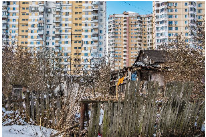
Na predmestí Moskvy, kde je niekedy ťažké rozoznať, kde končí mesto a začína vidiek

aj bývanie. Robotníci pracujú aj cez víkendy a niečo ako nočný pokoj tu zjavne neexistuje. Posledne ma zvuk zbyjačky zobudil okolo tretej nadržanom. Pojem „mesto, ktoré nikdy nespí“ dostal pre mňa úplne nový rozmer. Myslím, že sa to asi všetko deje „vo verejnom záujme“ a kontaktovať políciu by určite nemalo zmysel. V blízkej budúcnosti sú plánované aj ďalšie megaprojekty, ktoré zahŕňajú medzi iným búranie asi 8.000 starších bytových domov (tzv. Chruščovky) v centre mesta a presun okolo 1.5 milióna obyvateľov. Proti tomu sa už ale miestni začínajú ohradzovať a brániť. Prvá demonštrácia proti tomuto projektu sa uskutočnila len pred pár týždňami skoro priamo pod mojimi oknami.