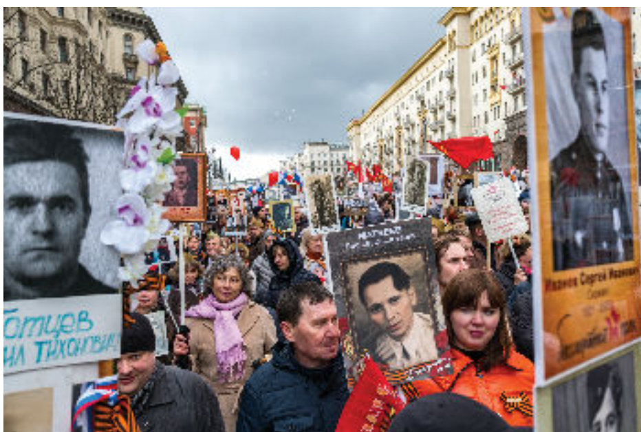
Pochod "nesmrteľného pluku"

svetovej vojny) 9. mája. V tento deň sa okrem známej vojenskej prehliadky na Červenom námestí koná aj pochod tzv. „nesmrteľného pluku“. V ňom pochodujú prípuzní padlých a účastníkov Veľkej vlasteneckej vojny