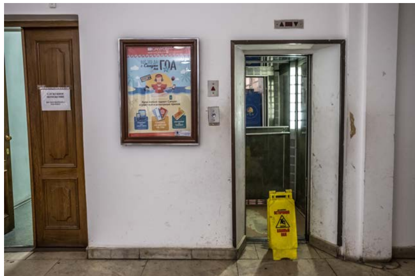
Toto vidím ráno veľmi nerád - znamená to jedenásť poschodí pešo do kancelárie.

Moskva už ponúka aj alternatívu k bežnej verejnej doprave v podobe bicyklov, ktoré sa dajú prenajať na viacerých miestach. V uliciach je ale stále ešte len zriedkavo možné zazrieť odvážlivcov vyhýbajúcich sa hustej premávke. V lete sa to možno zmení, kto vie, osobne by som ale život