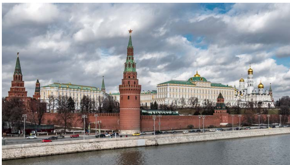
Povinné turistické foto.

Tentokrát nechám výskum výskumom a skúsim v mojom príspevku priblížiť pár drobností všedného dňa v ruskej metropole. Podobne ako každé veľkomesto aj Moskva si vyžaduje veľa energie, tolerancie, trpezlivosti a často predovšetkým pevné nervy. Aj keď sa život v Moskve stále viac a viac podobá na každodennosť iných veľkomiest, ešte stále je tu niekoľko vecí, ktoré sa inde bežne zažiť nedajú.