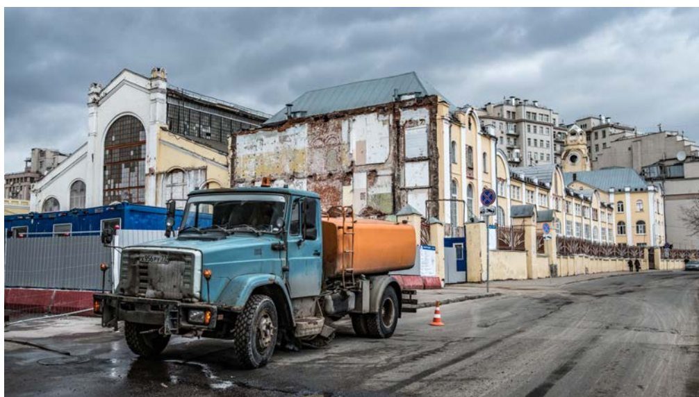
Nákladný automobil značky ZIL. Moskovská továreň tejto automobilky zo začiatku 20. storočia bola koncom minulého roku zbúraná.

Je koniec marca, tu v Moskve znova nasnežilo a teploty sú pod nulou – pomaly to už prestáva byť zábavné, ale ešte stále mám nádej, že kým v júni odíjdem, budem si môcť užiť aspoň začiatok jari :-)