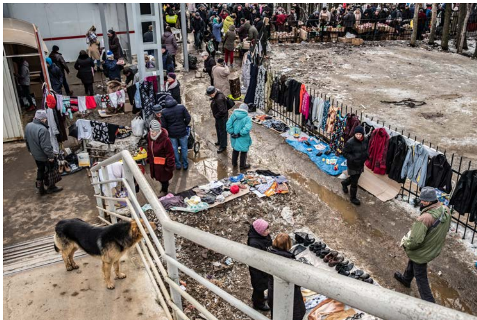
Blíší trh pri stanici Novopodrezkovo.

V prípade stravovania sa snažím cez týždeň využívať možnosti priamo na univerzite v menze. Tá je ešte stále rozdelená na časť pre pracovníkov univerzity a časť pre študentov. V kvalite ponúkaného jedla však už rozdiely nie sú. Porcie sú síce relatívne malé, ale keďže je náš kuchár z Gruzínska, je jedlo naozaj chutné. Domáci zvyknú bežné jedlo doplniť chlebom, ja skor uprednostním dodatočné „bliny“ (palacinky) alebo tvarohové koláče so smotanou ako dezert. Asi najpozitívnejším aspektom je ale fakt, že sa u nás v menze používa minimum v Rusku zbožňovaného a mnou nenávideného kôpru!