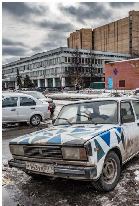
Všadeprítomná Lada a v pozadí Ruský štátny vojenský archív.

až po súpravu hrncov alebo prípravky schopné vyčistiť (údajne) úplne všetko. Namiesto toho sú vlaky čistejšie a pomedzi cestujúcich sa predierajú „len“ ľudia