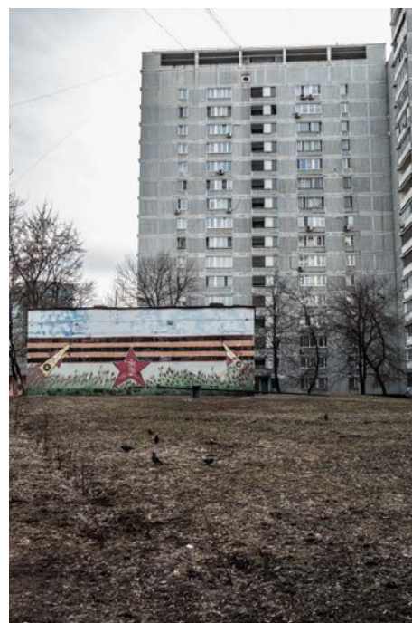
Nástenná "maľba" na sídlisku prezentujúca Veľkú vlasteneckú vojnu.

Od mojej poslednej návštevy pred tromi rokmi sa mesto samozrejme zmenilo. Žiaľ! nie každá zmena bola k lepšiemu. Viaceré staršie architektonicky zaujímavé budovy museli uvoľniť miesto novým developerským projektom. V metre sprísnilo kontroly. Okrem klasických detektorov, cez ktoré musí každý prejsť pribudli aj občasné kontroly tašiek. Policajnej kontrole sa nevyhne už ani nevinne vyzerajúci Slovák (s bradou už nevyzerám ako bežný Rus, ale dotyční policajti boli slušní a korektní). V prímestských vlakoch už nie je možné kúpiť všetko od občerstvenia