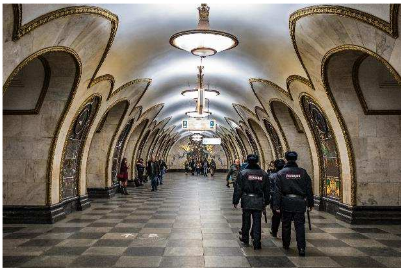
Stanica metra "Novoslobodskaja" - najbližšia k RGGU.

Moskva ako mesto mi nie je cudzia, keďže som tu pred niekoľkými rokmi absolvoval zahraničný štúdijný pobyt na Lomonosovovej univerzite a Nemeckom historickom inštitúte. Hneď po prilete ma síce mierne prekvapil dlhší „výsluch“ na colnej prepážke ohľadom účelu