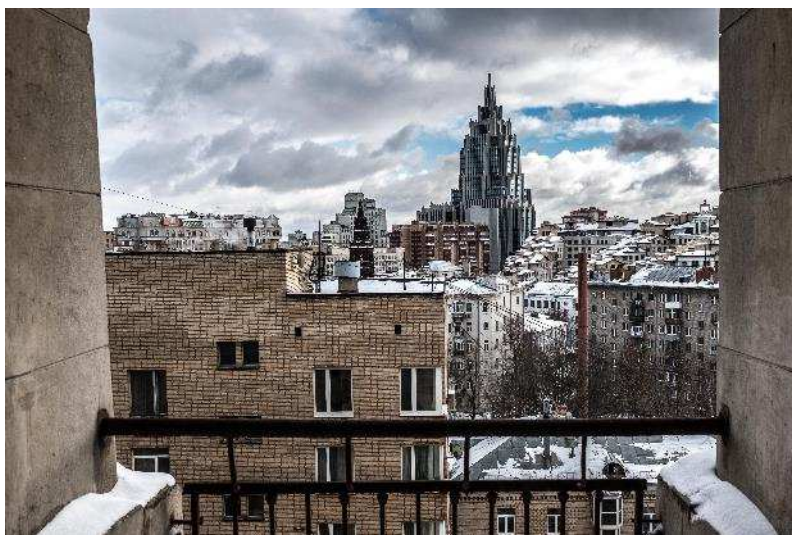
Výhľad z kancelárie.

Okrem bádania a spracovávania prameňov v kancelárii na 11. poschodí s celkom milým výhľadom budem viesť seminár pre študentov univerzity. Na príklade môjho vlastného výskumu sa im pokúsim sprostredkovať prípravu, priebeh a prezentáciu výskumu v humanitných vedách. Historik čerpajúci informácie prevažne