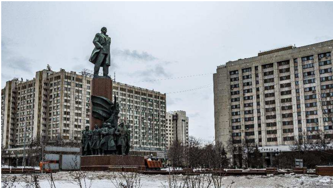
Keď sa stereotyp stane realitou pri stanici metra „Oktjabskaja“.

mieste je situácia trochu iná a veci je niekedy potrebné opakovať. V tomto prípade by som to ale nevidel ako vec osobnej zodpovednosti. Skôr je to fungovaním celého zbytočne komplikovaného systému, v ktorom každá kancelária zodpovedá za jeden úkon. Po dvoch týždňoch a návštevách viacerých kancelárií som už bol hrdým držiteľom všetkých potrebných dokumentov, vďaka ktorým môžem bezstarostne čeliť policajným kontrolám v meste. Miestny študentský preukaz mi však na rozdiel od toho zahraničného (medzinárodného) okrem iného umožňuje aj zľavnený vstup do múzeí, galérií a divadiel. Každý úradný papier, ktorý tu dostanem má zjavne svoje opodstatnenie, a väčšinu z nich by som mal aj stále nosiť so sebou.