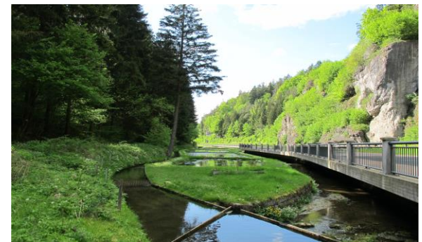
Foto: Die Fränkische Schweiz in der Nähe von Bayreuth