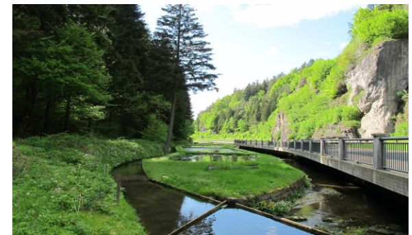
Foto: Die Fränkische Schweiz in der Nähe von Bayreuth