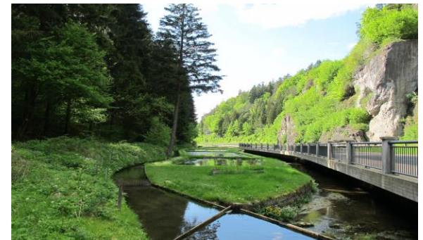
Foto: Die Fränkische Schweiz in der Nähe von Bayreuth