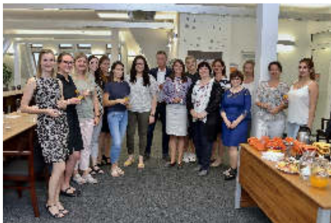
Předávání certifikátů absolventům kurzu DLL, 13. 7. 2020.