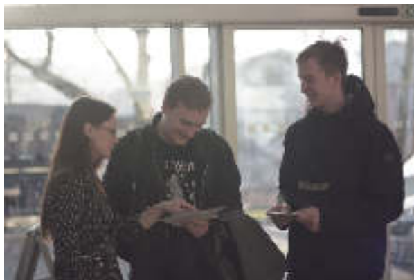
Den otevřených dveří na FF UJEP, 29. 1. 2020.