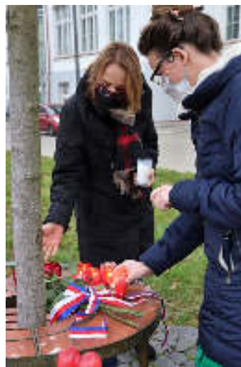
Svíčka za slova Václava Havla, 18. 12. 2020.

Kolektiv odborných pracovníků Katedry historie ve spolupráci s Muzeem města Ústí nad Labem, Archivem města Ústí nad Labem a dalšími institucemi v roce 2020 završuje dlouhodobý projekt, jehož výsledkem bude publikace mapového souboru kartografických materiálů v podobě Historického atlasu města Ústí nad Labem.