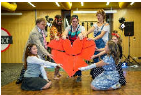
Ples FF UJEP, S Beatles do Žluté ponorky, 15. 2. 2020.