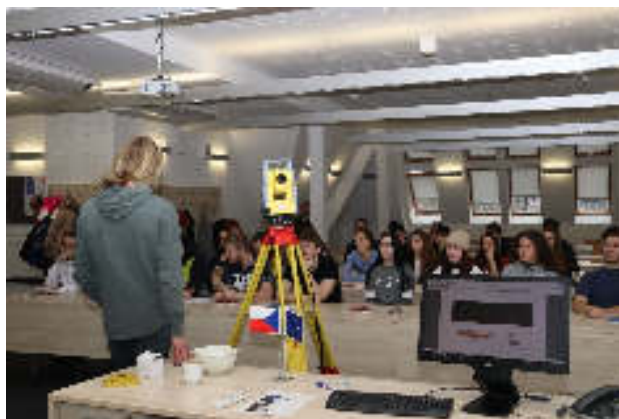
Jeden den na FF: představení práce Centra pro dokumentaci a digitalizaci kulturního dědictví, 28. 2. 2020.

Dlouhodobě je realizována funkční spolupráce s fakultními školami zahrnující i spolupráci při rozvoji motivace žáků ke studiu na vysoké škole.