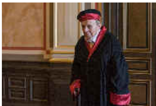
Prof. Erazim Kohák, dr. h. c.

Filozofická fakulta UJEP udělila dne 9. 3. 2017 v Císařském sále Muzea města Ústí n. L. čestný titul "doctor honoris causa" prof. Erazimu Kohákovi, Ph.D., českému filosofovi a publicistovi. Na slavnostní ceremoniál navázala beseda, při které představil svoji knihu Oheň a hvězdy.