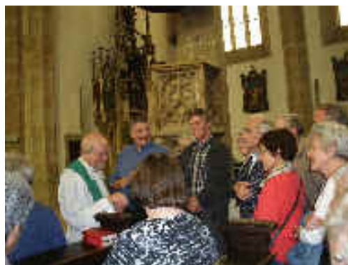
Účastníci XXVI. Colloquia Ustensia