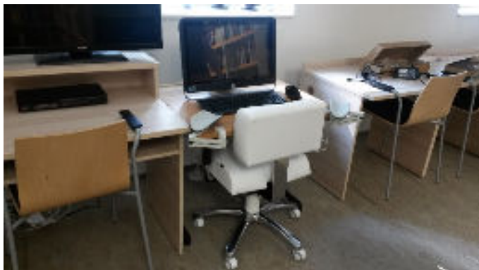
Speciální křeslo ve studovně KGER

Objekt Filozofické fakulty v ulici Pasteurova 13 nabízí, vzhledem ke své nedávné rekonstrukci, zcela bezbariérový přístup do všech veřejných prostor. Součástí studoven a knihoven jsou lehce dostupná počítačová místa. Konkrétně v mediotece katedry germanistiky je zřízeno optimalizované místo se speciálním koženým zdvižným křeslem a stolem, vč. počítačové techniky.