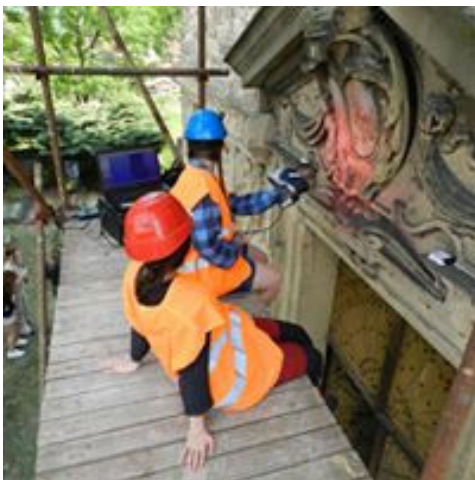
Praxe studentů v Záhořanech; 22. 5. – 2. 6. 2017

Centrum dokumentace a digitalizace kulturních památek FF UJEP uspořádalo pro studenty oboru Dokumentace památek a Kulturní historie odbornou praxi v Záhořanech u Litoměřic. Studenti se seznámili se současnými metodami dokumentace hmotných historických pramenů. Předmětem zájmu se stal kostel Nejsvětější Trojice v Záhořanech. Dále se studenti účastnili odborné praxe v kostele Nanebevzetí Panny Marie v Konojedech u Úštěka. Praxe byla realizována v rámci partnerství a vzájemné spolupráce v projektu Evropský hospodářský prostor ve spojení se Společností pro obnovu památek Úštěcka. Katedra historie úzce spolupracuje s organizací Člověk v tísni v rámci projektu Jeden svět na školách .