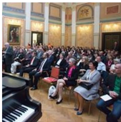
Zahájení mezinárodní konference 4. 10. 2016 v Ústí nad Labem

Katedra germanistiky prezentovala svůj aktuální výzkum v oblasti interkulturní germanistiky na mezinárodní konferenci „ Rozmanité koncepty – koncepty rozmanitosti: Interkulturalita(y) ve světě “, která proběhla 4. - 9. října 2016 v Ústí nad Labem a Praze za účasti více než 200 odborníků z celého světa (48 zemí). Cílem bylo představit způsoby popisu interkulturních jevů v různých částech světa, různých oborových disciplínách a prezentovat širší existující teoretické koncepty. K tomu přispěly jak přednášky z oblasti literatury v obecných kulturních souvislostech, například ve vztahu k fenoménu migrace, tak i příspěvky lingvistické, didaktické či translatologické. Největší sekce se věnovala literárním textům a filmům, druhá největší byla zaměřena na historický kulturní prostor českých zemí.