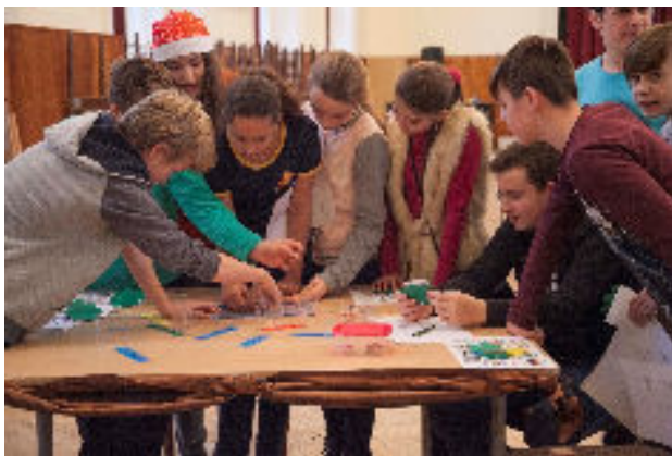
Motivační den pro žáky základních škol, pořádaný katedrou germanistiky v prostorách FF UJEP 24. 11. 2016

V roce 2016 uspořádala katedra historie ve spolupráci s Muzeem města Ústí nad Labem a Společností pro dějiny Němců v Čechách konferenci Orosené dějiny; Ústecká pivní konference, ve spolupráci s Městskou částí Praha 3 se uskutečnila výstava Rok 1866 a za podpory Ústeckého kraje se uskutečnila krajské kolo dějepisné soutěže pro studenty SŠ a gymnázií.