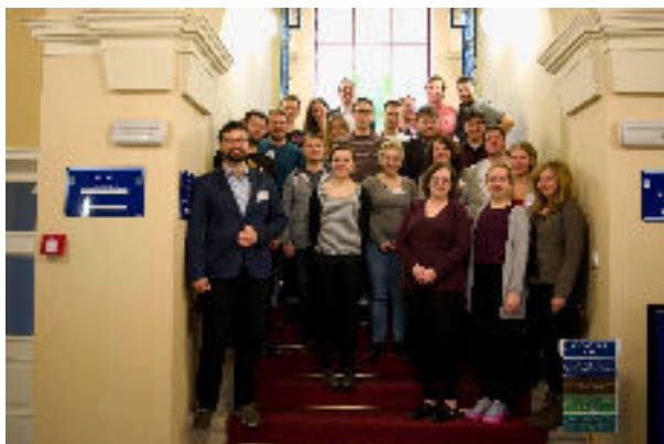
Setkání zástupců studentských historických spolků z Česka i Slovenska; 19. - 20. 3. 2017

Na půdě FF UJEP se uskutečnilo setkání zástupců studentských historických spolků z Česka a Slovenska. Cílem bylo sdružit prostřednictvím delegátů všechny studenty historie a komparovat studijní úspěchy i aktivity.