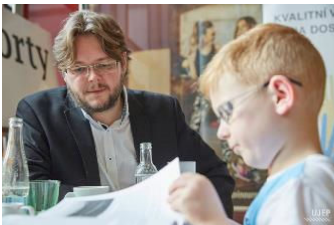
Káva s vědcem, obchodní centrum Fórum v Ústí nad Labem, 7. 4. 2016