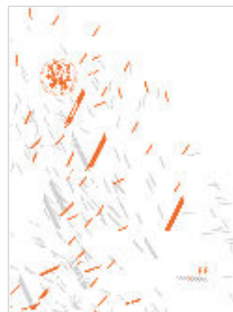
brožura o fakultě