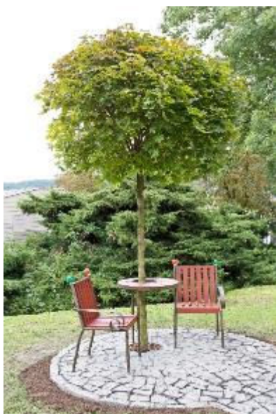
Lavička Václava Havla v areálu Kampus

U příležitosti oslav deseti let od svého založení připravila fakulta akci s názvem Týdny humanitních věd, v rámci které uspořádala besedy, přednášky, koncerty pro širokou veřejnost. Hlavním bodem oslav bylo slavnostní odhalení Lavičky Václava Havla (obr. 4), čímž si akademičtí pracovníci a studenti připomněli odkaz i nedožitě osmdesáté narozeniny Václava Havla. Večer byl završen koncertem skupiny The Tap Tap v Severočeském divadle. Cílem této akce bylo iniciovat debatu o významu a postavení humanitních věd v dnešním světě.