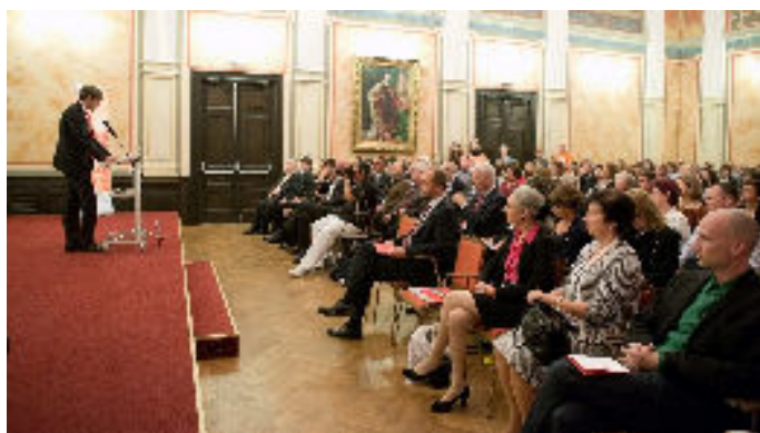
Rakouský velvyslanec slavnostně zahájil mezinárodní germanistickou konferenci 4. 10. 2016 v Císařském sále Muzea města Ústí nad Labem

Na půdě FF UJEP se konala mezinárodní germanistická konference „Rozmanité koncepty – koncepty rozmanitosti: Interkulturalita(y) ve světě“. Konference se týkala zmapování interkulturních konceptů s cílem získat přehled o modelování interkulturních fenoménů v rozličných oblastech světa, kulturách a oborech. Cílem bylo provést inventarizaci celé šíře možností chápání interkulturality a na tomto základě dále rozvíjet rozmanitost teorií – a to nejen v rámci literární vědy a vědy kulturní, ale také z pohledu lingvistiky, výzkumu multilingválnosti, didaktiky, němčiny jako cizího jazyka a translologie, jakož i všech ostatních oborů, které mohou k této obecné otázce ze svého pohledu produktivně přispět a taktéž diagnostikují komplexní interkulturní fenomény, příp. reflektují jejich přiměřený popis. Konference se zúčastnilo přes 200 odborníků ze 48 zemí světa všech pěti kontinentů.