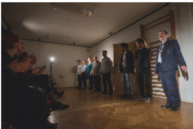
Scénické čtení studentů DAMU z překladu studentů KGER hry „Kalhoty žena kolo“ v Činoherním studiu 29. 11. 2016