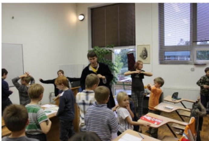
Teen Age University