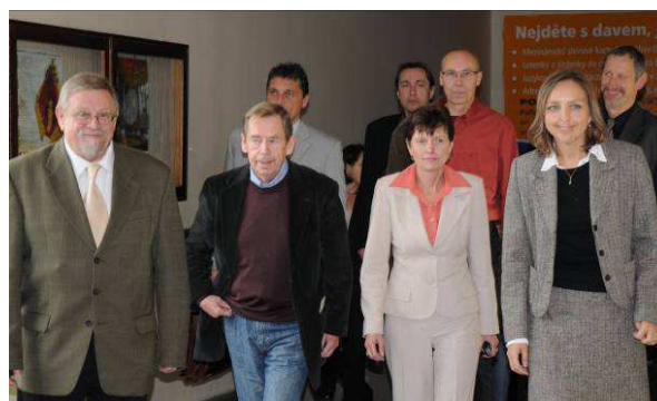
Setkání a debata s dramatikem, exprezidentem občanem Václavem Havlem