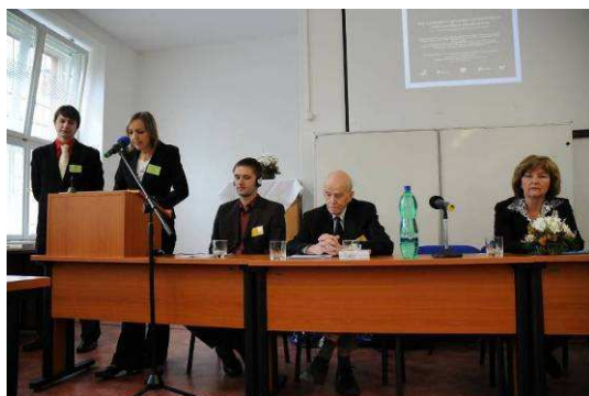
„Stav a perspektivy zpřístupňování středověkých a raně novověkých městských knih“, konference